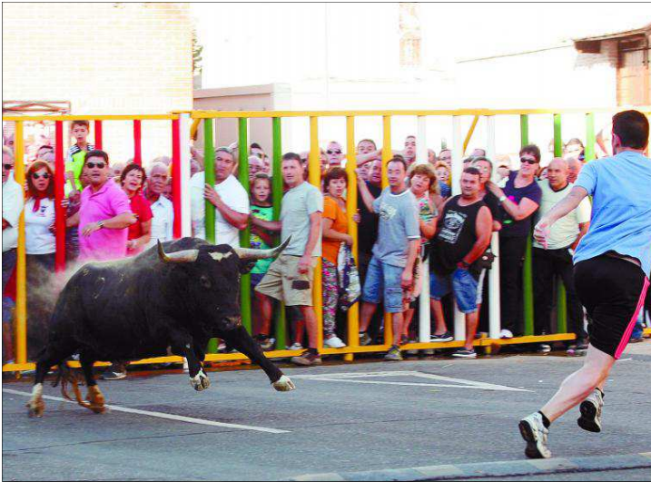
Espectacular salida del camión de una de las reses del primer encierro de las fiestas de Villaseca de la Sagra.

Tuvieron que afanarse los valientes a sacar citando a los astados desde muy cerca, jugándose literalmente el tipo. Una vez el primero pisó el asfalto de la calle, un ir y venir de aficionados se dedicaron a cortar, recortar y torear con