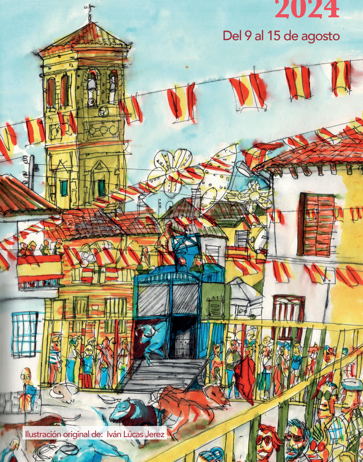
Ilustración original de: Iván Lucas Jerez